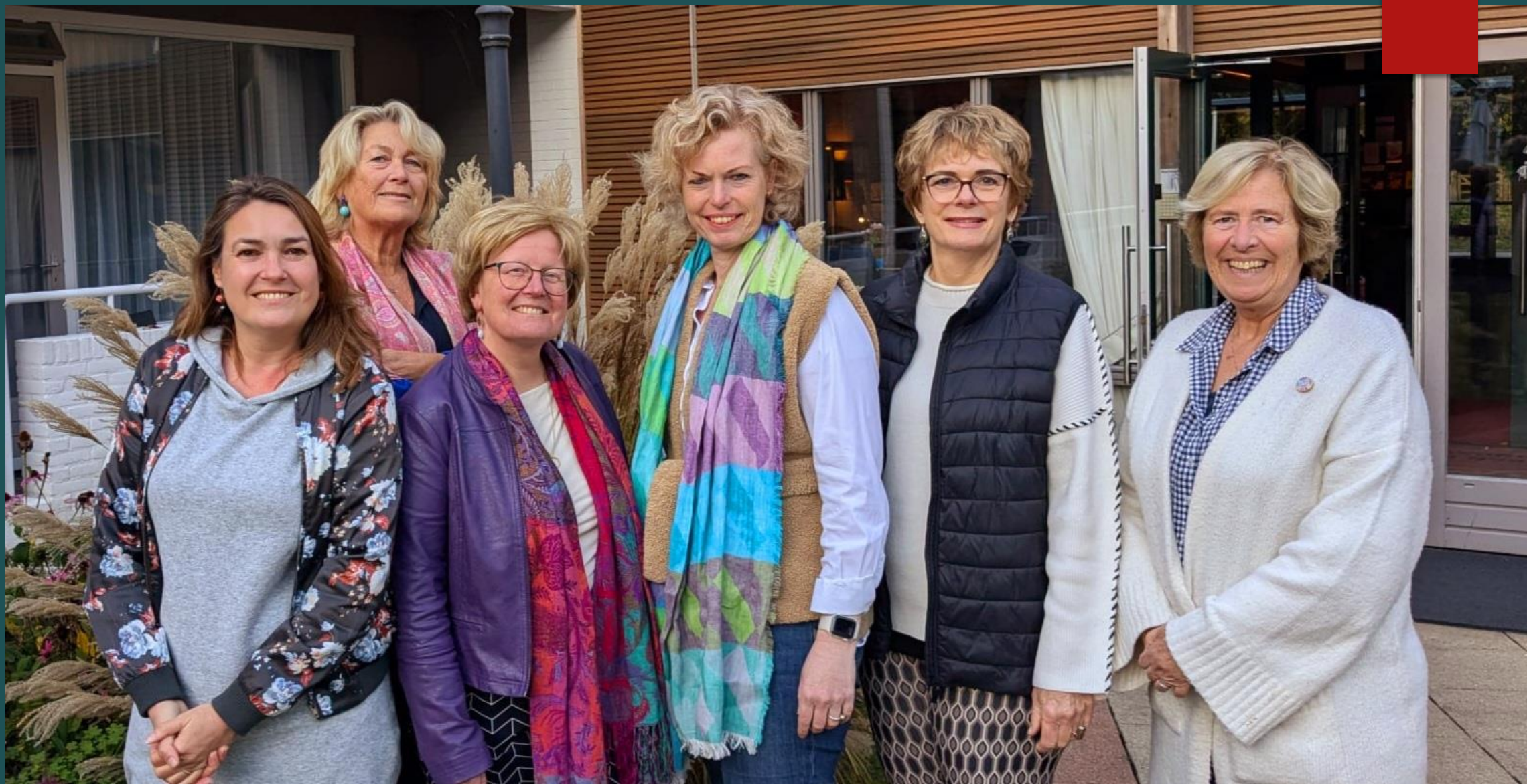
HPV WERKGROEP OKTOBER 2024