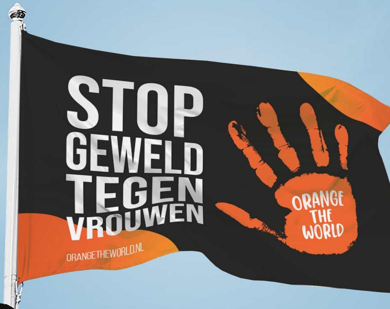
Orange the World vlag